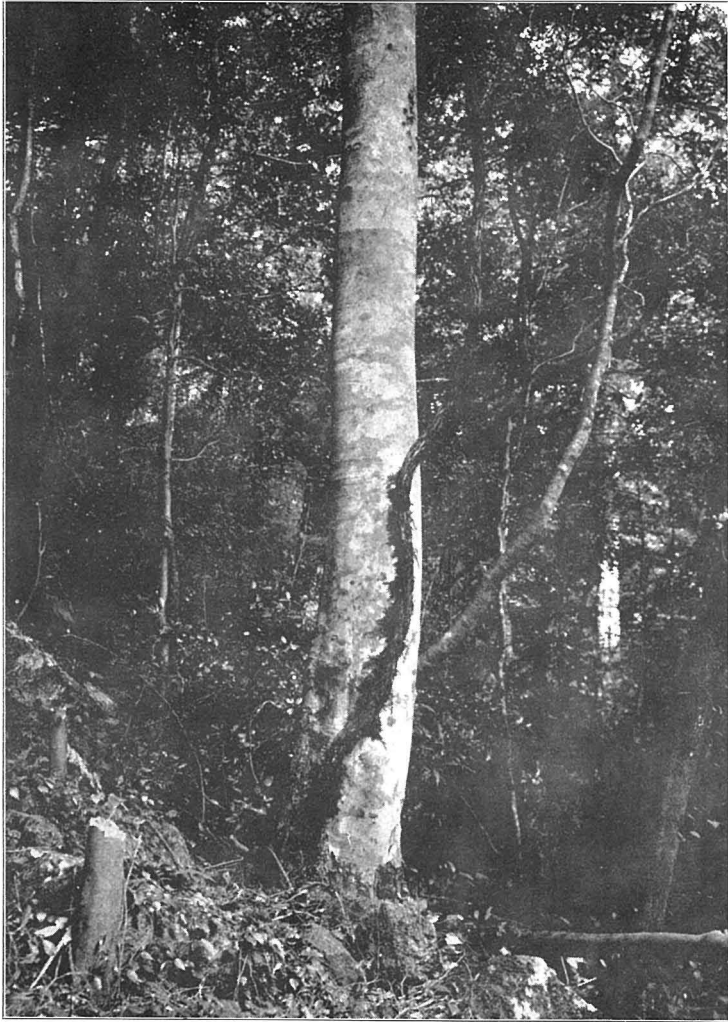
古代砂糖ニ代用セシ甘葛煎ノ基本植物