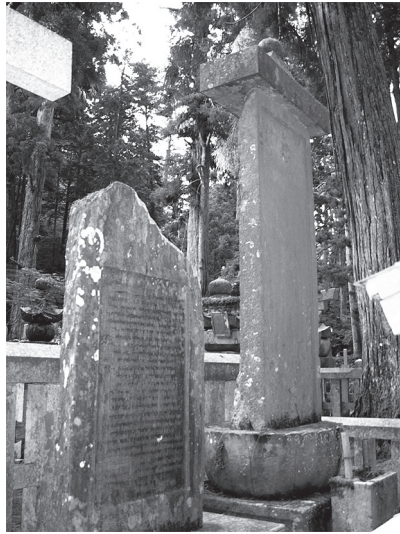
高麗陣敵味方供養塔

四方ほどの穴を掘り、埋め直した後に松の木をその上に植えて標としている。 (94) 一方、『島津義弘公記』では、「此の如く毎戦敵屍を葬り、塚を築き弔事を修むるは、島津陣中の恒例なり。此時も大慈寺、萩原寺、卒土婆を立て以て之を執行せり」と人道主義を尊重するが如く自慢した。 (95) それに留まらず、朝鮮に侵略した島津義弘と忠恒の父子は一五九九年、高野山奥の院の自らの墓域に、泗川城で戦死した倭軍・朝鮮人（明軍）の「高麗陣敵味方供養塔」を建てたのである。このように、朝鮮で切り取った鼻と耳そして首の塚は京都以外にも、岡山・鹿児島などにもあったのである。