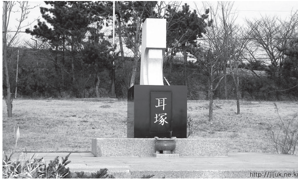
泗川の朝明軍塚にある耳塚

一方、耳塚は外国人にとって衝撃的な史跡であった。一九二〇年頃、アメリカ人がこれを見て衝撃を受け、当時朝鮮総督であった齋藤実に撤去を求めた。耳塚は欧米人にとっても、この世にあつてはならないマイナスの遺産であった。まして当事者である韓国人にとっては言うまでもなかった。このような心境が、朝鮮通信使の記録や植民地時代の京都の日刊紙への投稿によく表れている。今日もそれはまったく変わらない。