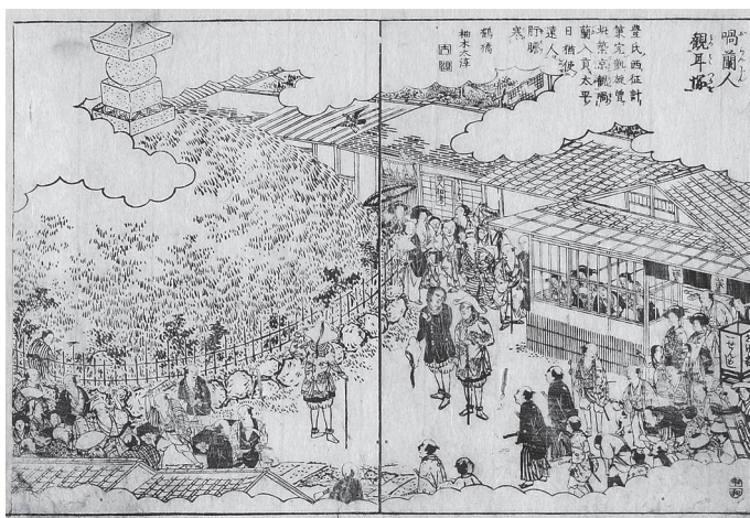
耳塚を観るオランダ人（『都林泉名勝図会』より）

ることであり、とんでもない日本人の無知と非常識を表すのと同じだと厳しく批判したのである。