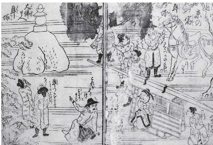
耳塚へ参る朝鮮通信使一行（『朝鮮人来朝物語』より）

一六二五年一月一七日に耳塚を見て、「心の痛みに耐えきれなかった」と記した (16) 。これらの悲憤について、林羅山は『豊臣秀吉譜』に「其後、朝鮮人来貢之時、到塚下、誦祭文而弔之、哭泣曰、是輪死報国者也 (16) 」と書いており、日本側の別の記録『洛陽名所集』（四卷）にも、「耳塚を見た高麗人で涙を流さない人は一人もない」と書かれている。ここでの「高麗人」とは言うまでもなく朝鮮人をさす。