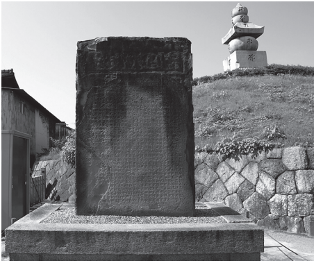
豊公 300 年祭記念碑

政治的に利用した。一八九八年の秀吉没後三〇〇年には、「豊公三〇〇年祭」として京都で盛大な祭典を行った。当時、日本は日清戦争を経て朝鮮で次第に西欧の列強を押し退け、有利な立場を占めつつあった。耳塚を修築することで、国民に対し、朝鮮侵略の意味を再認識させる必要があった。 (82)