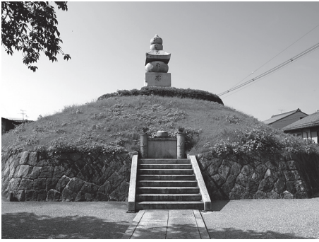
耳塚（京都市東山区）

内容にまでは踏み込んでいないが、耳塚の由来について一定の知識を得ることができるとのだろう。だが、研究者の立場から見ると、案内板の説明だけでは解決不能な疑問点が次々に浮かんでくる。以下、順不同に挙げてみよう。